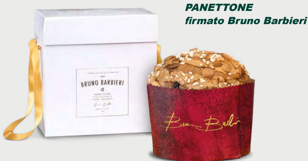
PANETTONE firmato Bruno Barbieri

Anche quest'anno si rinnova l'impegno dello Chef che destinerà nuovamente parte del ricavato dei panettoni tradizionali ad ANT ed ai suoi assistiti.